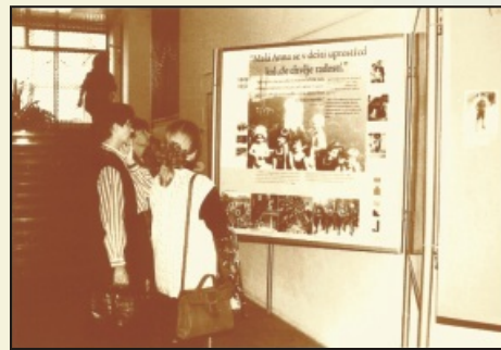
Putovní výstava o Anni Frankové, Muzeum ghetta, Terezín The travelling exhibiton about Anne Frank, Ghetto Museum, Terezín

In February and March 2003 two seminars were held in Prague and Terezín entitled "How to teach the Holocaust." 111 Czech teachers participated. As well as lectures and workshops, the participants had an opportunity to see the performance based on the work of Jiří Weil "Elegy for the 77,297 victims" which was performed by the "Miriam" theatre company from Prague. More of these seminars will be held in spring 2004.