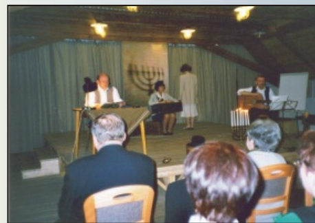
Představení divadelního souboru Miriam, seminář pro pedagogy „Jak vyučovat o holocaustu“, březen 2003

V únoru a v březnu probíhaly v Praze a v Terezíně dva semináře „Jak vyučovat o holocaustu“. Zúčastnilo se jich 111 českých pedagogů. Kromě přednášek a workshopů měli účastníci možnost zhlédnout také představení na motivy díla Jiřího Weila „Žalozpěv za 77 297 obětí“ v provedení divadelního souboru Miriam z Prahy. Další tyto semináře probíhají nyní na jaře 2004.